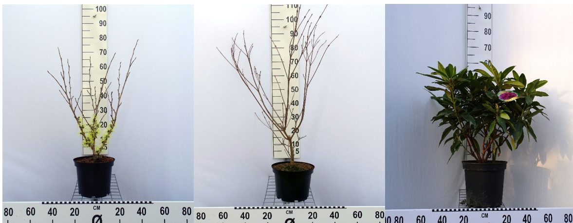
Hamamelis int. 'Angelly' C5 40-60